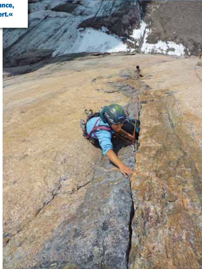
Ganz weit weg: Die abgelegensten Wände der Welt braucht Silvia, um ausreichend intensive Aufgaben zu finden – ob in Patagonien („Espiadimonis“, o.) oder auf Baffin Island.

musste mit Händen und Füßen kommunizieren, um herauszufinden, wie man den Wandfuß erreicht.“ Mehrfach irrte sie sich beim Zustieg, schleppte die Haulbags in ein Tal, das plötzlich endete. Doch auch im richtigen Basecamp konnte sie die Wand nicht sehen. Es war Monsunzeit und der Nebel lichtete sich während ihres gesamten Aufenthaltes kein einziges Mal.